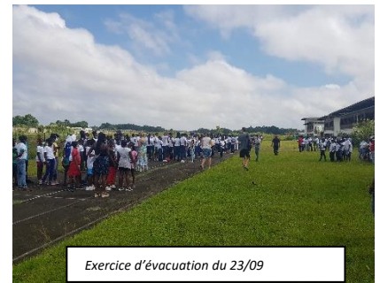
Exercice d'évacuation du 23/09