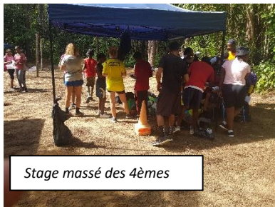
Stage massé des 4èmes

-Les coordonnateurs de discipline sont invités à faire remonter au plus tôt les sujets du Brevet Blanc prévues dans une quinzaine de jours. La date limite est fixée au 07 décembre 2021.